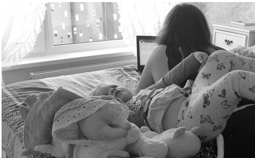
Töö ja lapsed käivad käsikäes.